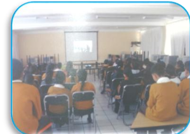
Esc. Prim. Francisco del Olmo